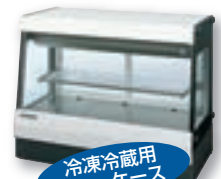
冷凍冷蔵用 ショーケース