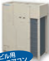
ビル用 マルチエアコン