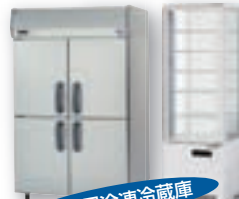
業務用冷凍冷蔵庫